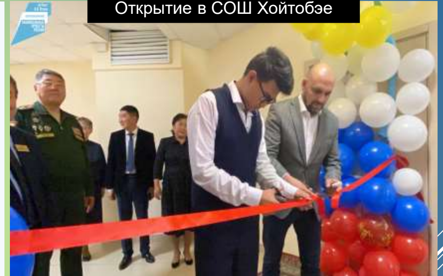
Открытие в СОШ Хойтобэе

На сегодня в районе действует 13 Центров образования «Точка роста»