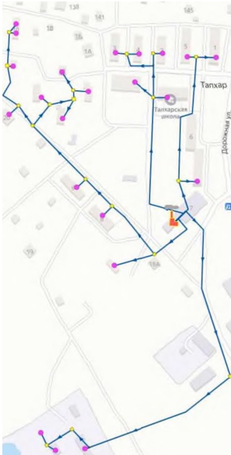
Рисунок 1. Графическая схема тепловых сетей котельной п. Талхар.