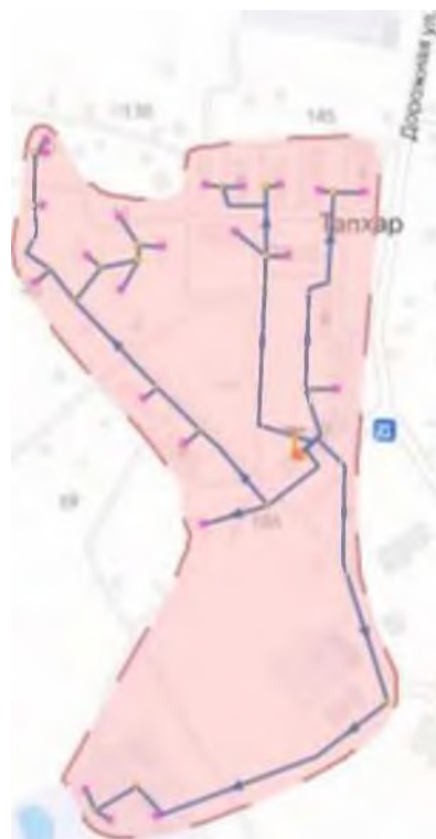
Рисунок 3. Зона действия источника теплоснабжения и. Талхар.