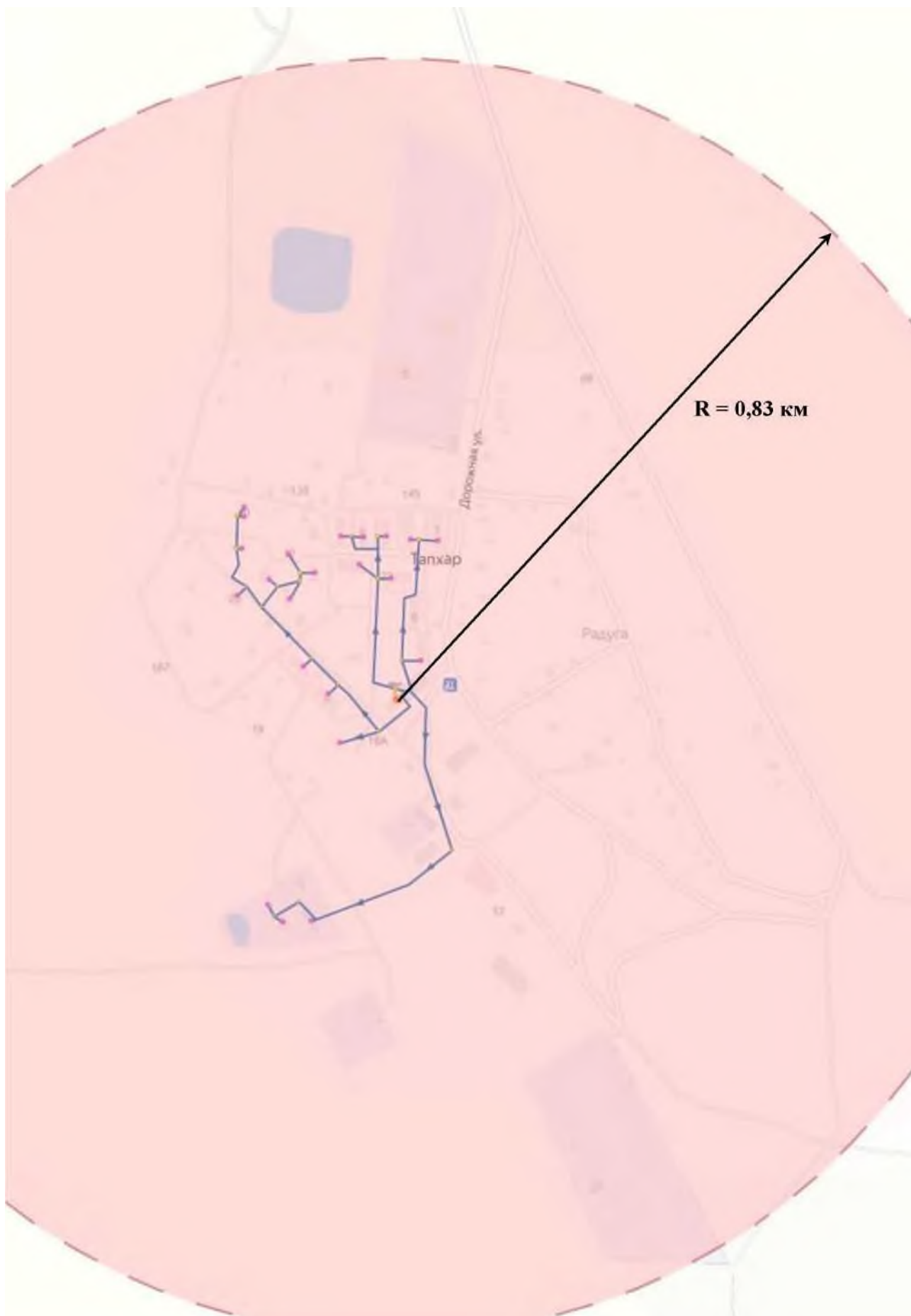
Рисунок 4. Радиус эффективного теплоснабжения котельной п. Тапхар.