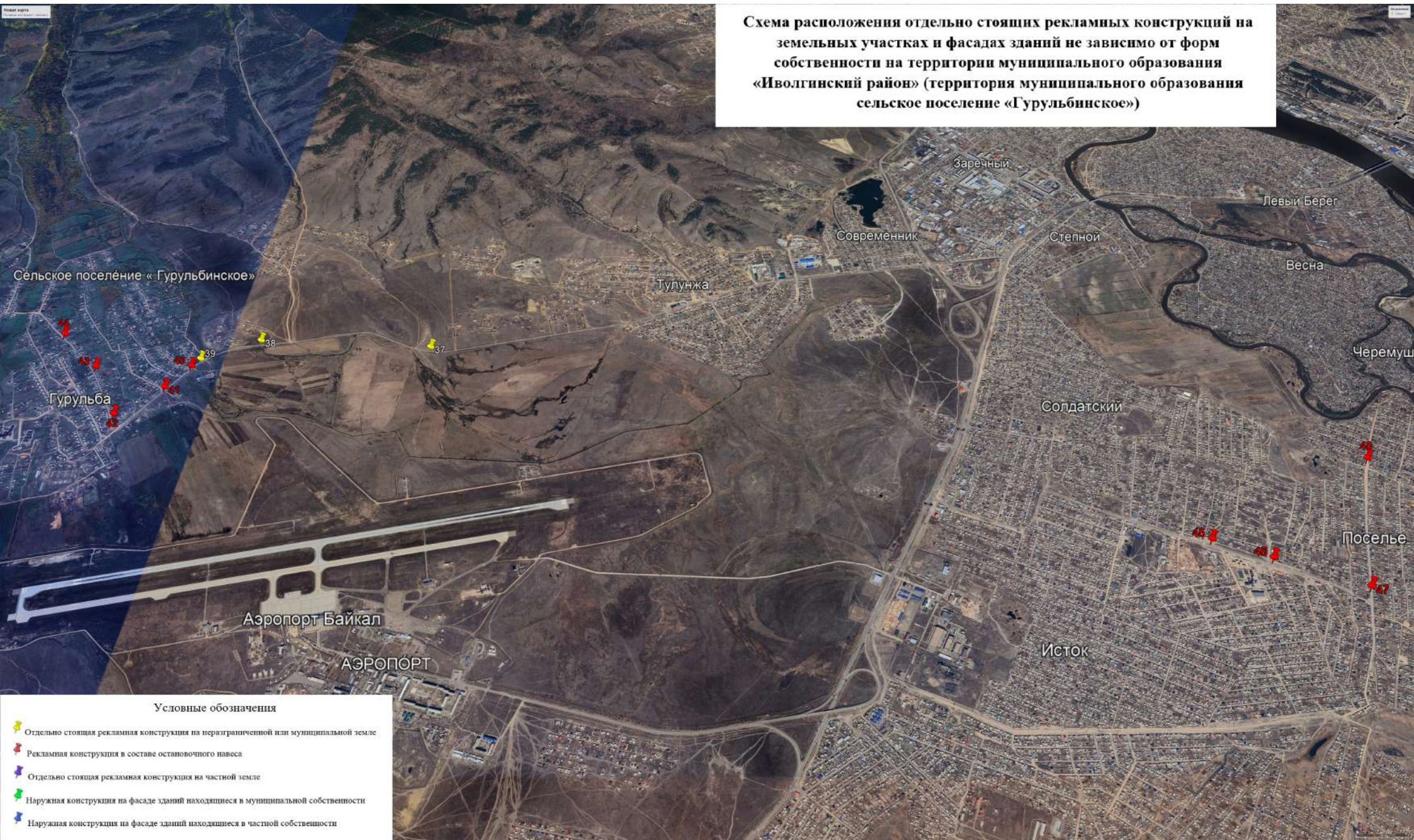
Схема расположения отдельно стоящих рекламных конструкций на земельных участках и фасадах зданий не зависимо от форм собственности на территории муниципального образования «Иволгинский район» (территория муниципального образования сельское поселение «Гурульбинское»)